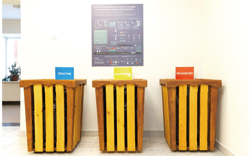
На третьем этаже установлены контейнеры для раздельного сбора мусора — пластика, крышечек от пластиковых бутылок, аккумуляторных батареек, бумаги

— Мы давно поняли, — продолжает Юлия Владимировна, — что участие в экологических акциях не только замечательное семейное времяпрепровождение, но и великолепный вариант тимбилдинга. Каждый выход на природу превращается в праздник. А коллектив становится большой дружной семьёй.