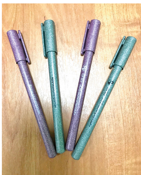
Ручки, сделанные из тетрапака

В целом, Облкомприрода занимается мониторингом состояния окружающей среды и обеспечением выполнения соответствующих ме-