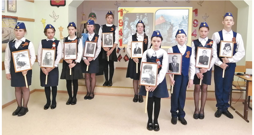
Ребята участвуют в акции «Бессмертный полк»

Мы всегда помним, что ребёнок — это, прежде всего, душа. И чем больше ниточек любви её связывает с окружающим миром, тем она богаче, щедрее, чище и добрее. Поэтому стараемся развивать гуманитарное направление, связанное с творчеством и патриотическим воспитанием.