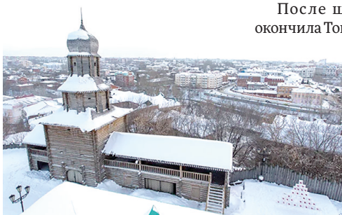
► Здание музея истории Томска