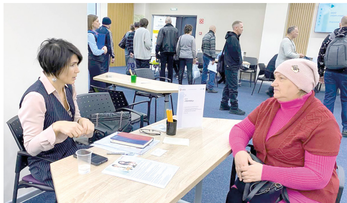
► Из ста участников ярмарки вакансий восемь сразу были приняты на работу и 36 резюме работодатели взяли на более детальное рассмотрение

Для людей с инвалидностью была организована экскурсия в АНО ДПО «Школа безопасности», чтобы все желающие могли ознакомиться с профессией охранника. Экскурсантам рассказали, какова специфика этой работы в разных отраслях экономики, в каких случаях предусмотрено ношение оружия, что нужно для того, чтобы устроиться охранником и многое другое.