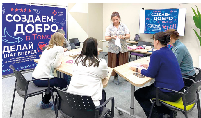
► Ведущие мастер-классов показали, что каждому под силу изготовить ароматическую экосвечу, сделать ровную строчку и уходовый маникюр

продажа изделий прикладного творчества особенных мастеров «Лавка добрых дел». В торговоразвлекательном центре «Лето» в пятничный вечер 8 декабря каждый мог оценить качество изделий ручной работы и купить сувениры и полезные вещи