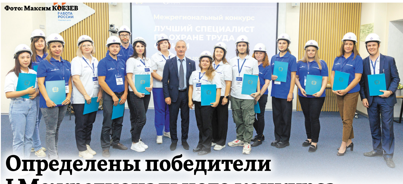
Фото: Максим КОБЗЕВ РАБОТА РОССИИ