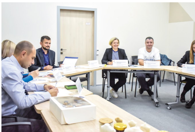
► Экспертная комиссия

С целью содействия началу осуществления предпринимательской деятельности безработных граждан, на площадке кадрового центра «Работа в России» города Томска и Томского района проводятся такие мероприятия, как бизнес-акселераторы, семинары, мастер-классы, деловые встречи, тренинги, мастермайнды.