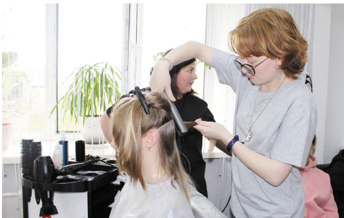
► Мастер-класс в студии красоты для вожатых

Мы признательны центру занятости за сотрудничество. Дело в том, что заработная плата вожатых совсем небольшая и складывается не в последнюю очередь из той субсидии, которую предоставляет служба занятости. Более того, представители ЦЗН всегда присутствуют на открытии лагеря, которое стараются совместить с открытием Трудового лета.