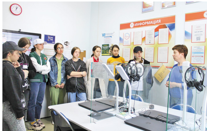
► Экскурсия для вожатых в Бакчарскую библиотеку