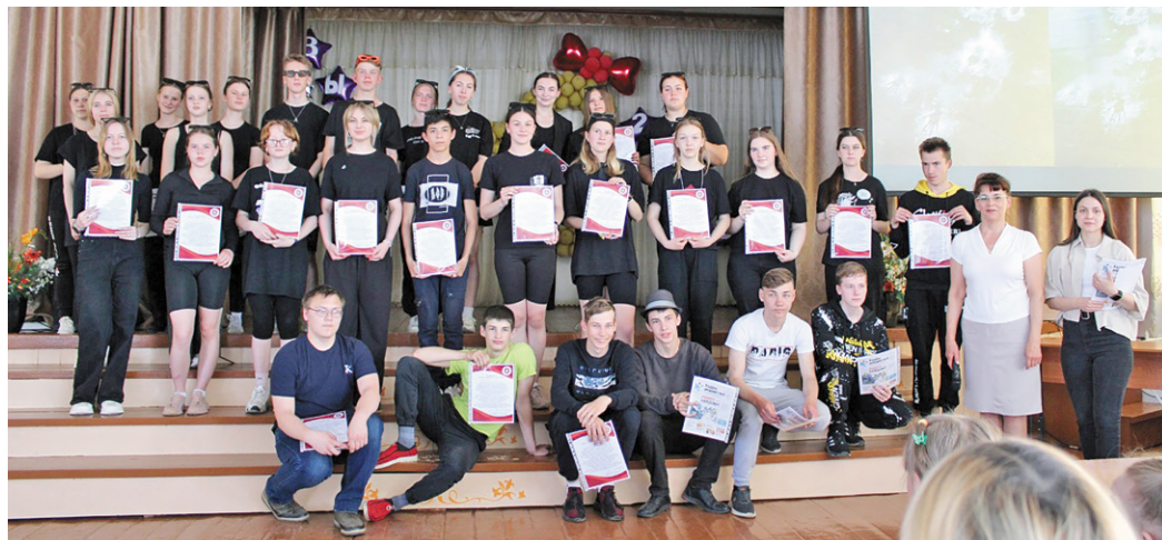
► Ученики старших классов могут устроиться вожатыми в летние смены лагеря «Солнышко»

Лагерь настолько популярен среди школьников, что ежегодно сюда приезжают ребята из сопредельных населённых пунктов и даже из областного центра. К сожалению, в период пандемии сократилось количество мест (было около 350, стало до 250), но лагерь развивается! За время смены ребята так