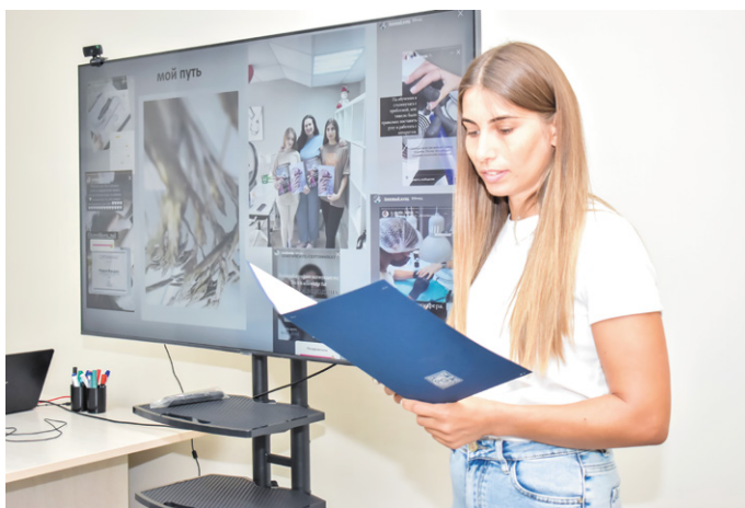
► Защита бизнес-планов безработных граждан