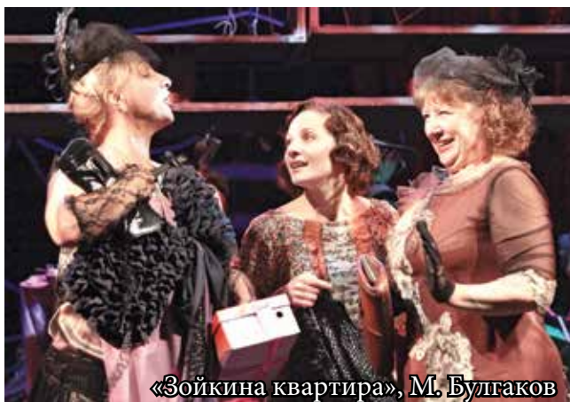
«Зойкина квартира», М. Булгаков