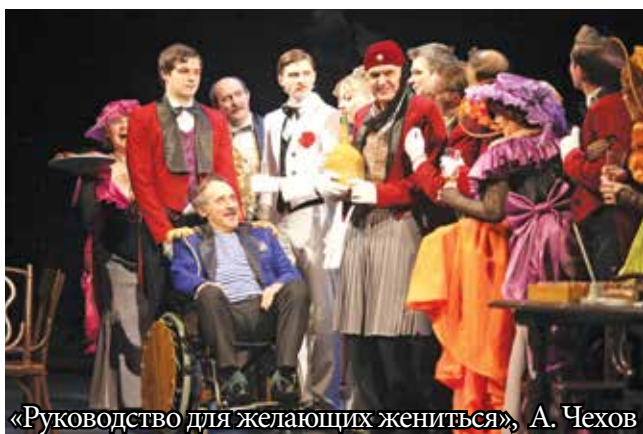
«Руководство для желающих жениться», А. Чехов