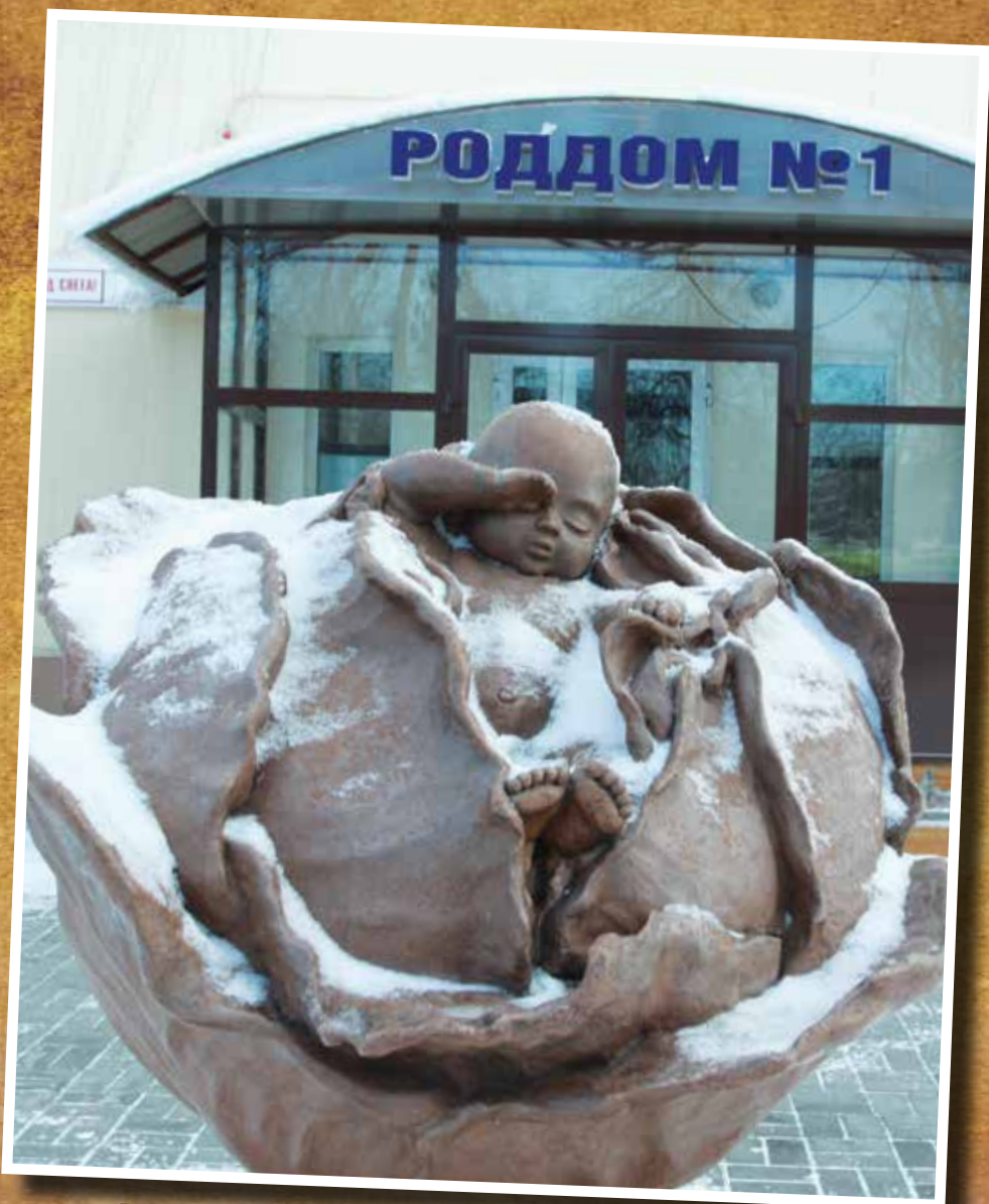
Памятник ребёнку, найденному в капусте. Установлен в 2008 году. Автор: Олег Кислицкий.