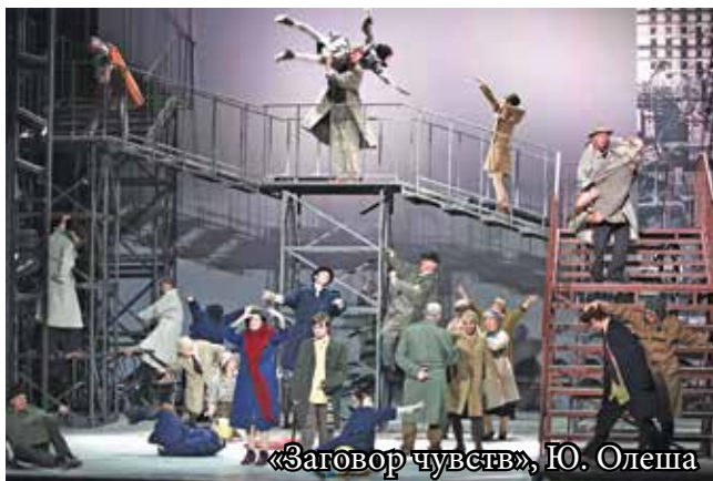
«Заговор чувств», Ю. Олеша

Адрес: г. Томск, пер. Нахановича, 4, касса – (3822) 51-36-55, справка – (3822) 51-72-77, 51-47-17. tomsktuz@trecom.tomsk.ru Сайт: tuz-tomsk.ru