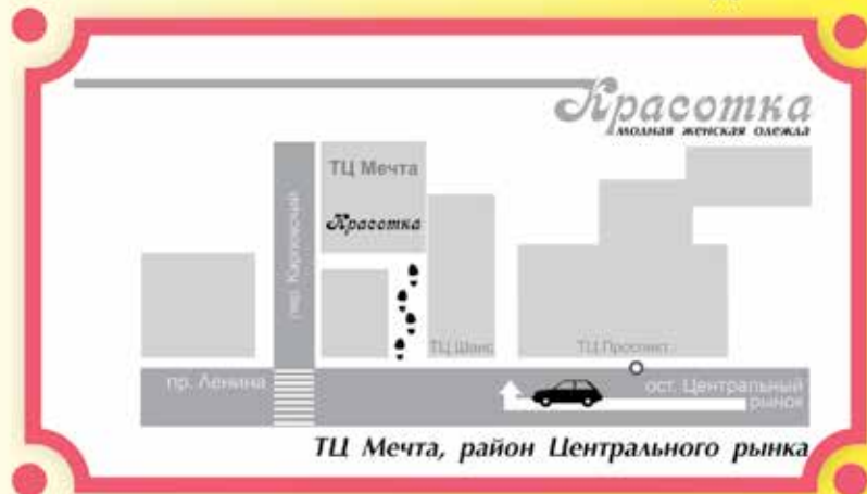
ТЦ Мечта, район Центрального рынка

ТЦ «Мечта», пер. Карповский, 13 (ост. «Ц. рынок») ул. Пушкина, 27е, (ост. «Ул. Пушкина»)